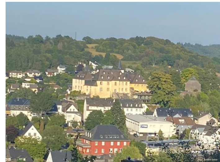
Das Foto zeigt die Dauner Burg